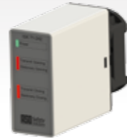
INDUS rail 71-242 1204-0100