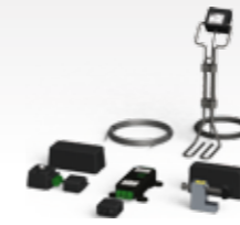
INDUS compact micro 77 W Set S 1210-0320