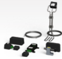
INDUS compact micro 77 E Set S 1210-0260