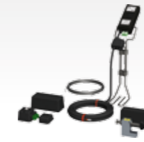
INDUS compact easy 77 E Set S 1320-0300