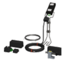
INDUS compact easy 77 R Set S 1320-0330