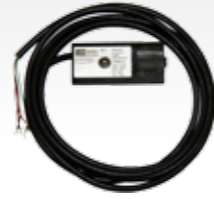
INDUS micro 83-477 Auf Anfrage! | On request!