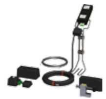
INDUS compact easy 77 W Set S 1320-0360