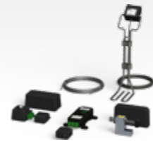
INDUS compact micro 77 R Set S 1210-0290