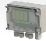
INDUS classic 74-312 1206-0060