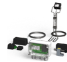
INDUS compact classic 74-312 Set S 1206-0010