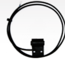
SPK 84 Auf Anfrage! | On request!