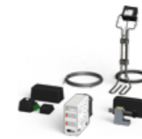
INDUS compact rail 71-242 Set S 1204-0010