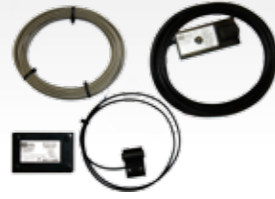
INDUS vertical basic Auf Anfrage! | On request!