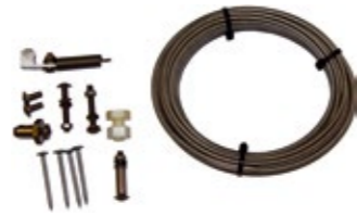
ISB V1 Auf Anfrage! | On request!